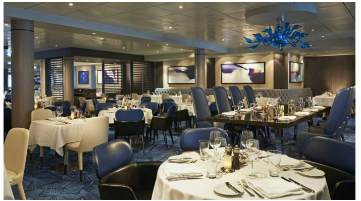
Ravintola Aqua Norwegian Dawn