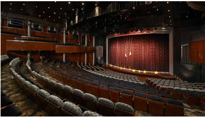
Stardust teatteri Norwegian Dawn