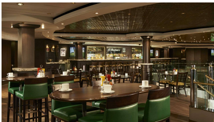
O Sheenans pub Norwegian Dawn