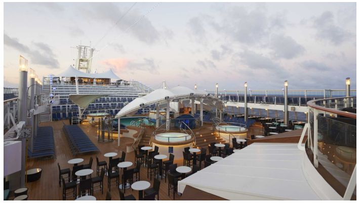
Allaskansi 1 Norwegian Dawn