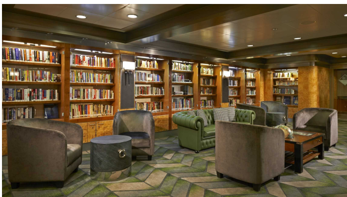
Kirjasto Norwegian Dawn