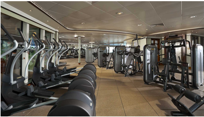
Kuntosali Norwegian Dawn