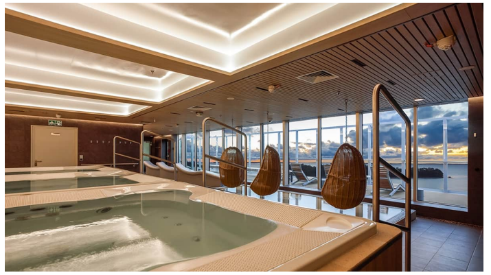
Sauna Spa Superstar Iq