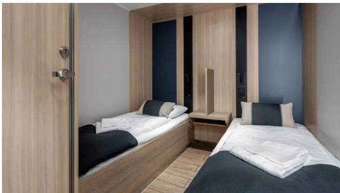
Sisähytti Economy Superstar lk