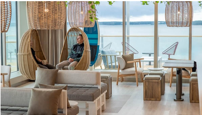
Spa Bar Superstar Iq