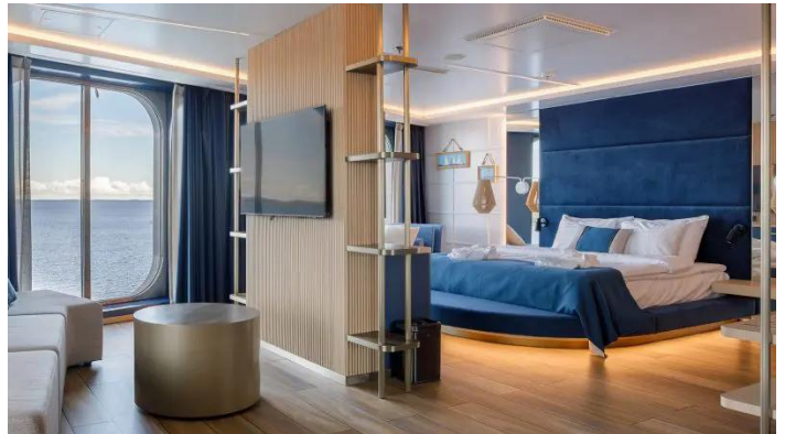
Junior Suite Superstar lk