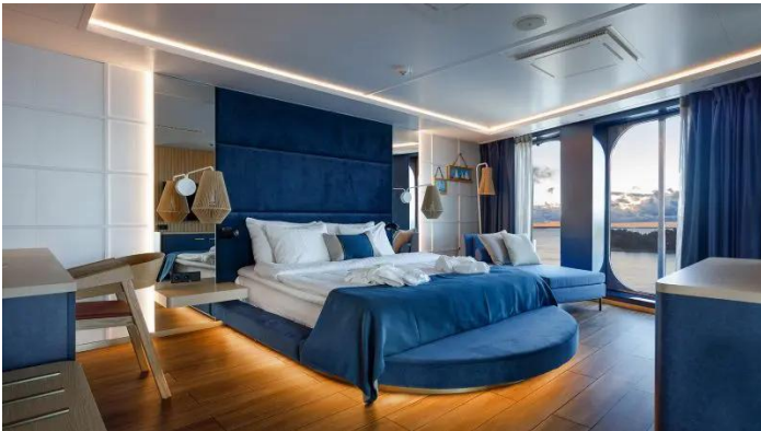
Owners Suite Superstar lk

Ikkunaton kahden hengen hytti. Varustukseen kuuluvat kaksi alavuodetta ja suihku/WC.