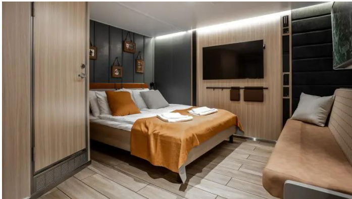
Ikkunallinen hytti Standard Superstar lk