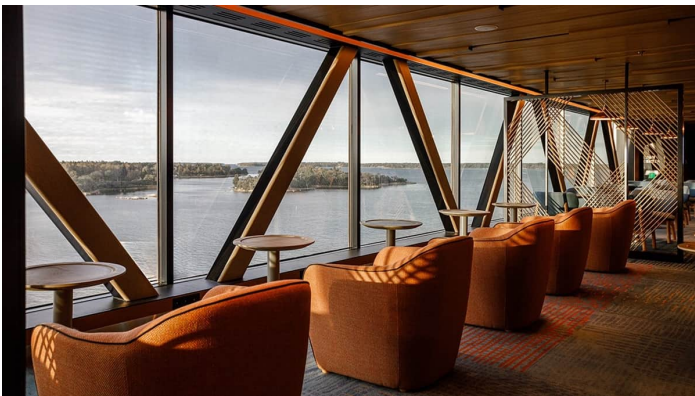
Stellar Lounge Superstar Iq