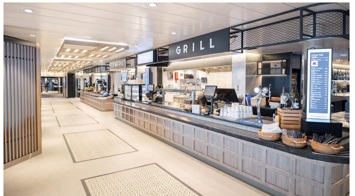
Fisherman Bistro Superstar Iq