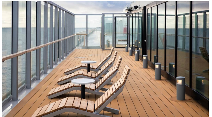
Spa ulkokansi Superstar Iq