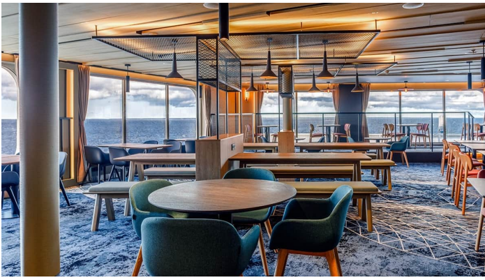
Cargo Buffet Superstar Iq