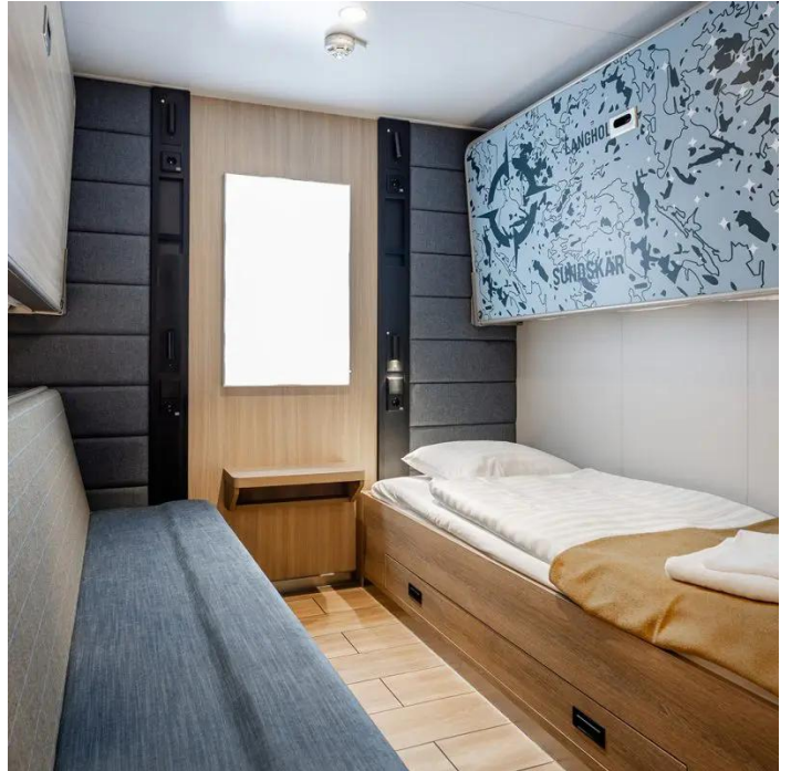
Ikkunallinen hytti Economy Superstar lk