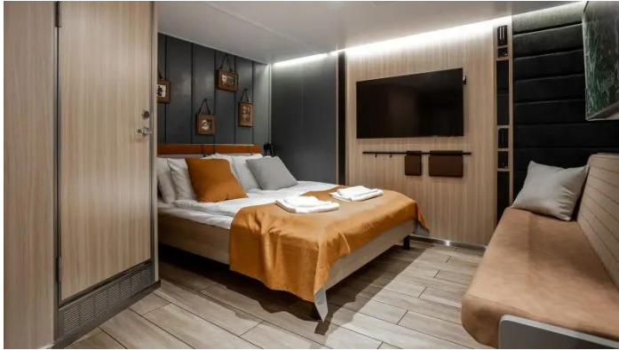
Ikkunallinen hytti Standard Superstar lk