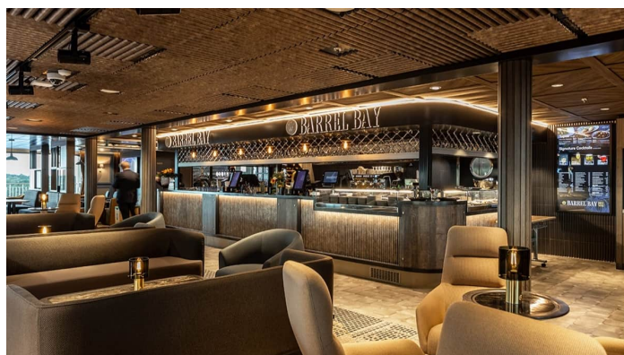
Barrel Bay baari Superstar lk