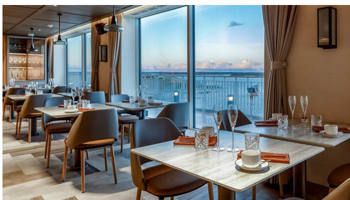
A la Carte Mickes Superstar lk