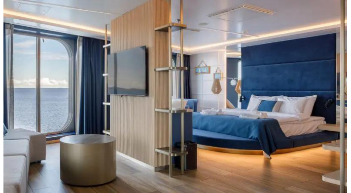
Junior Suite Superstar lk