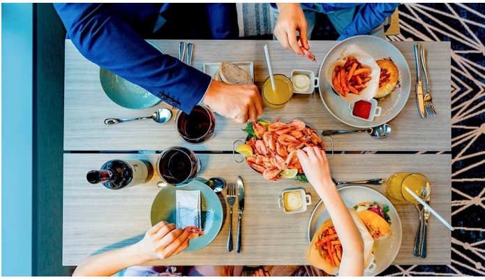
Fisherman Bistro ruokailu Superstar lk