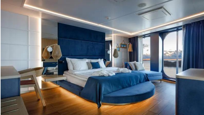
Owners Suite Superstar lk

Ikkunaton kahden hengen hytti. Varustukseen kuuluvat kaksi alavuodetta ja suihku/WC.