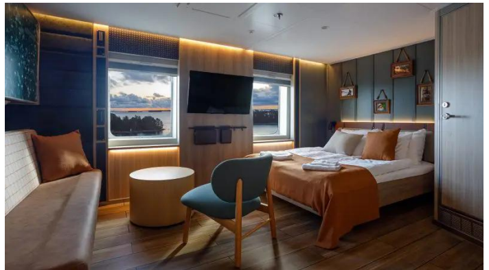
Ikkunallinen hytti Comfort Superstar lk