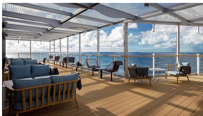
Terassi Superstar lk