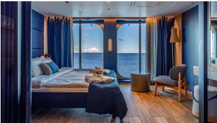
Lux hytti Superstar lk