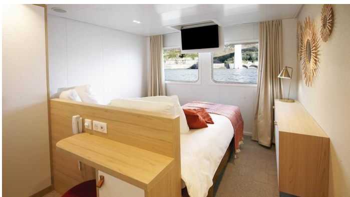
Kahden hengen hytti alin kansi Amalia Rodrigues