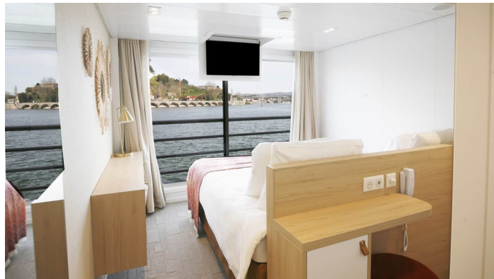
Kahden hengen hytti 2. kansi Amalia Rodrigues