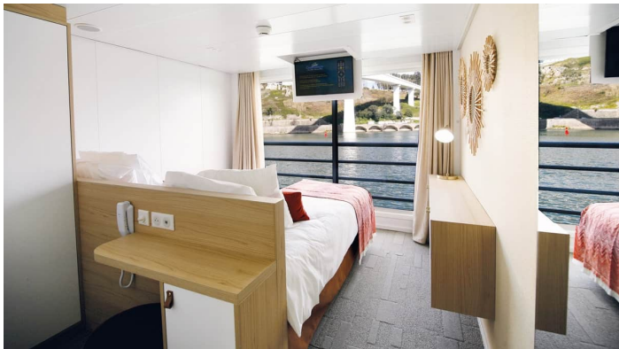
Kahden hengen hytti ylin kansi Amalia Rodrigues CroisiEurope

Kaikki hytit ovat ikkunallisia. Ylimmän ja keskimmäisen kannen hyteissä on avattavat ikkunat ranskalaisella parvekkeella. Hyttien varustukseen kuuluvat suihku & wc, hiustenkuivaaja, TV, radio ja tallelokero sekä wifi. Kaikki hytit ovat ilmastoituja. Hyttikuvat ovat viitteellisiä. Huomioithan että laivalla ei ole pesulapalveluja.