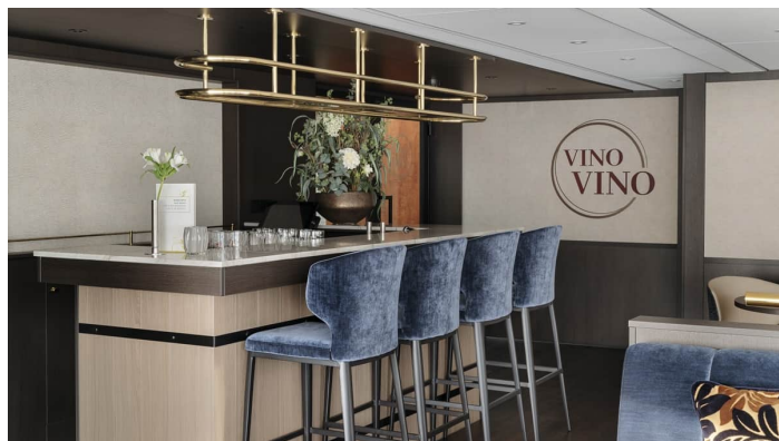
VinoVino Gloria