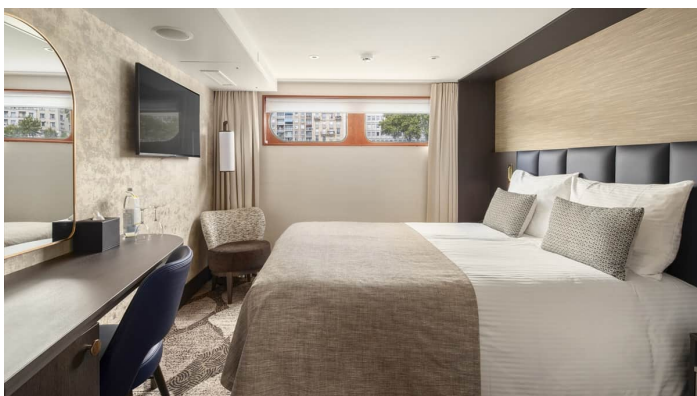
Ikkunallinen hytti 1. kansi Gloria