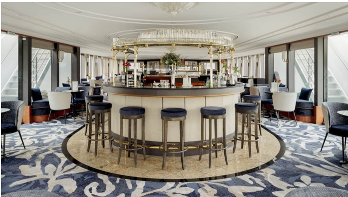
Lounge Bar Gloria