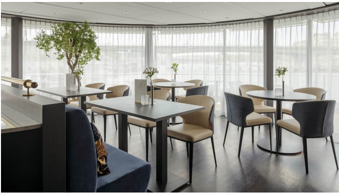
Vino Vino Gloria