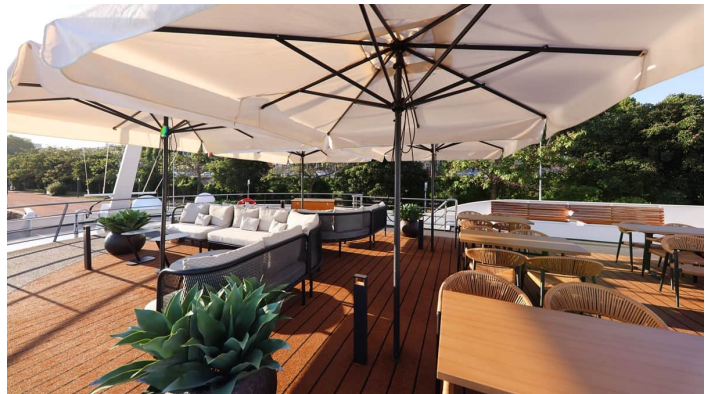
Aurinkokansi Gloria