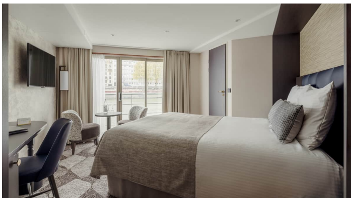
Junior Suite Gloria

Jokaisen hytin varusteluun kuuluvat taulutelevisio, hiustenkuivaaja, tallelokero, ilmastointi, suihku/WC