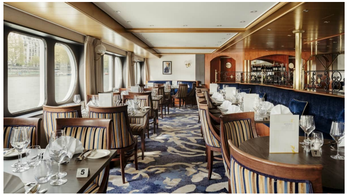
Ravintola Gloria