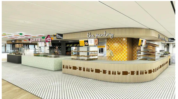
Marella Voyager The Kitchens