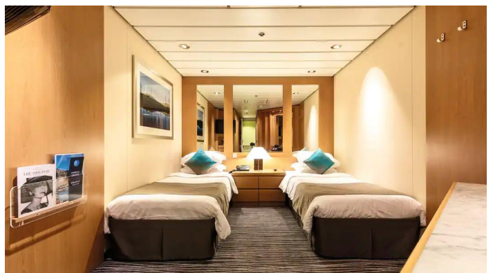
Marella Voyager sisähytti