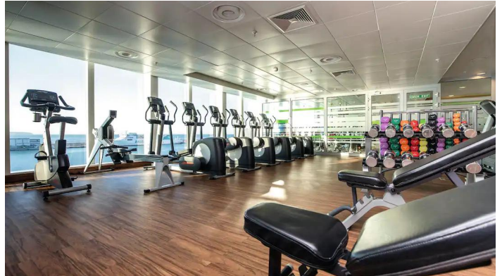
Marella Voyager kuntosali

Marella Voyagerin palvelut tarjoavat monipuolisia vaihtoehtoja niin ruokailuun, viihteeseen kuin vapaa-ajan viettoon: 16 eri ravintolaa, useita baareja, erilaisia loungeja, kauppoja ja hyvinvointipalveluja kuten Spa ja kuntosali. Tarkemmat tiedot kaikista palveluista ja tarjonnasta selviävät laivalla.