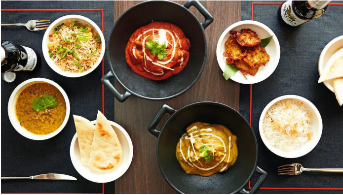
Marella Voyager Snack Shack