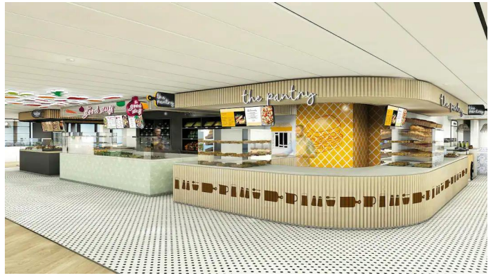
Marella Voyager The Kitchens