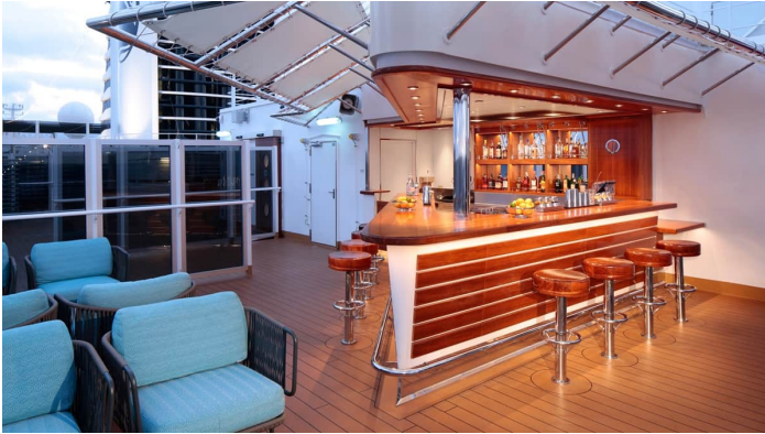
Rotterdam Tamarind terassi