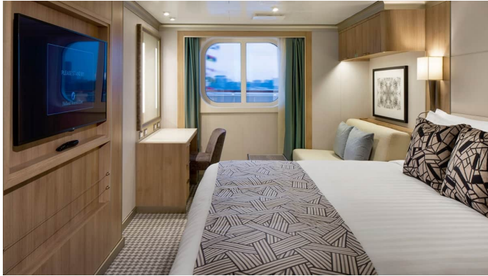
Rotterdam Vista Suite