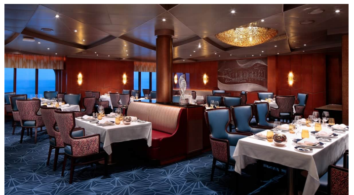
Rotterdam pääruokasali