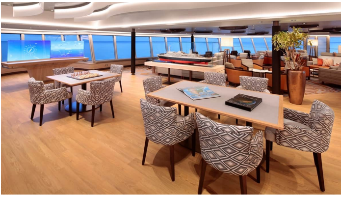
Rotterdam Crow's nest