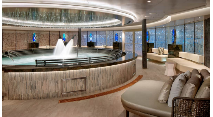
Rotterdam Tamarind