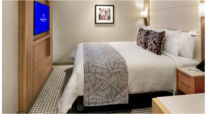
Rotterdam parvekehytti