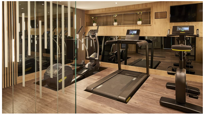
Viva One aurinkansi 2