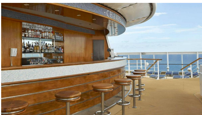
Champs allasbaari Norwegian Sun