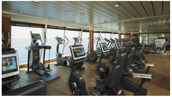
Kuntosali Norwegian Sun