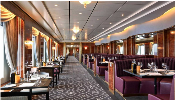
La Cucina ravintola Norwegian Sun