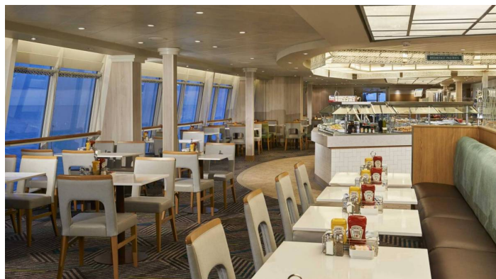
Garden Cafe Norwegian Sun