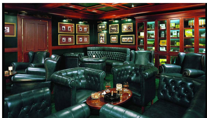
Churchill Cigar Bar Norwegian Sun