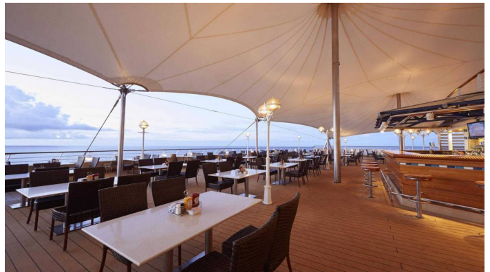
Great Outdoors Norwegian Sun