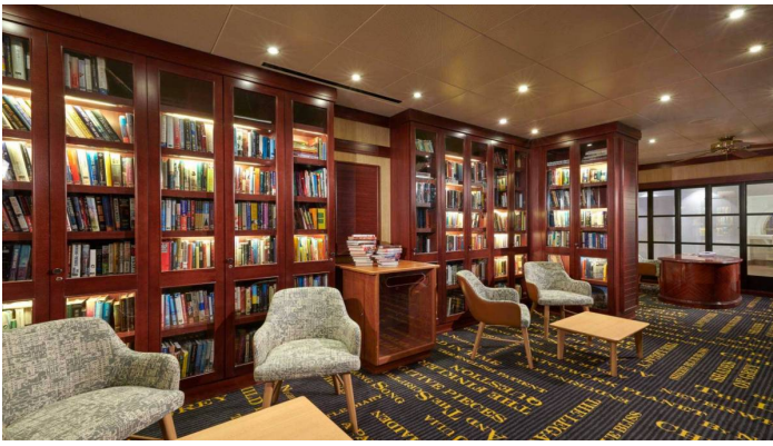
Kirjasto Norwegian Sun