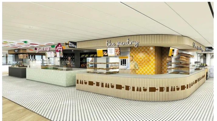
Marella Voyager The Kitchens