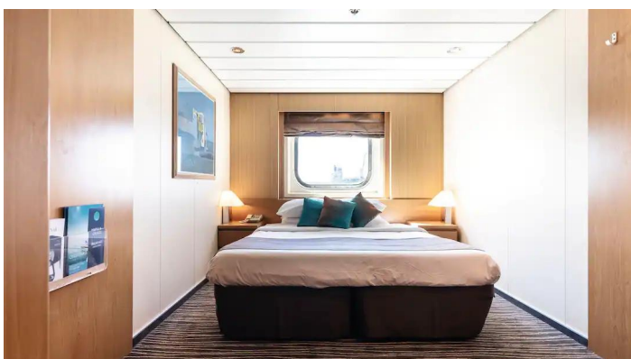
Marella Voyager ikkunallinen hytti