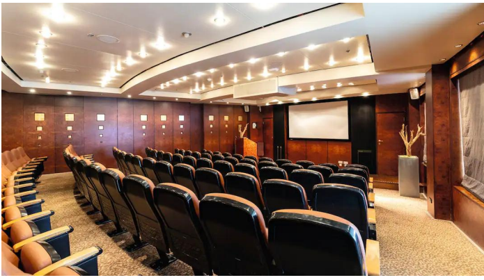
Marella Voyager elokuvateatteri