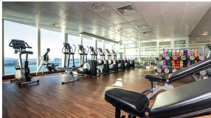
Marella Voyager kuntosali