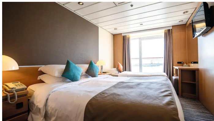
Marella Voyager parvekehytti