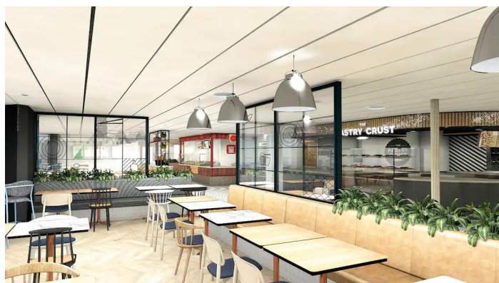
Marella Voyager Kitchens