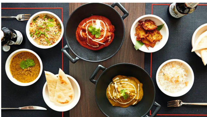
Marella Voyager Kora La