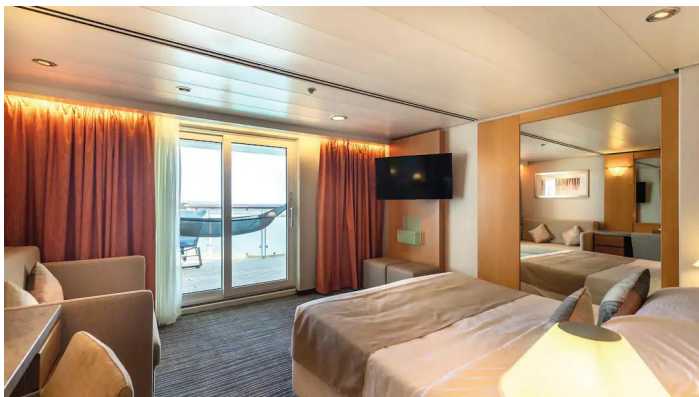
Marella Voyager Junior Suite

Marella Voyagerin hytit on varustettu ilmastoinnilla, hiustenkuivaajalla, taulutelevisiolla, vaatekaapilla sekä tallelokerolla. Huom. hyttikuvat ovat viitteellisiä.