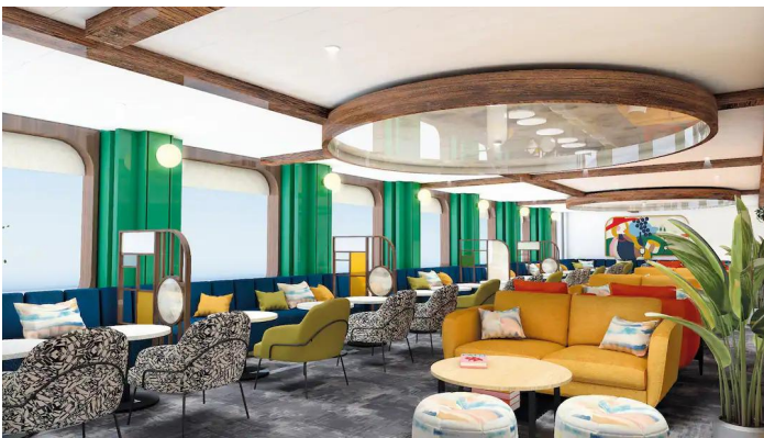
Marella Voyager the Arts House