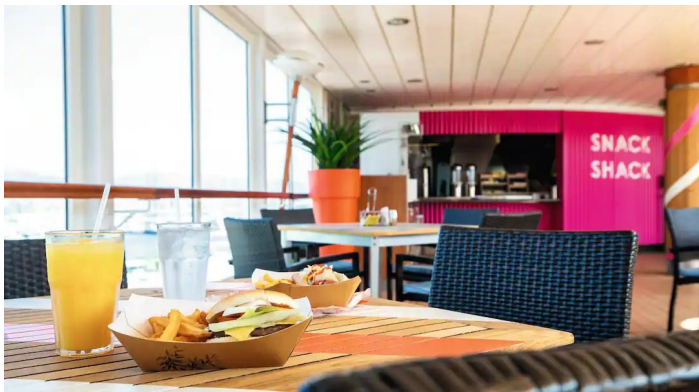
Marella Voyager Snack Shack

Marella Voyagerin palvelut tarjoavat monipuolisia vaihtoehtoja niin ruokailuun, viihteeseen kuin vapaa-ajan viettoon: 16 eri ravintolaa, useita baareja, erilaisia loungeja, kauppoja ja hyvinvointipalveluja kuten Spa ja kuntosali. Tarkemmat tiedot kaikista palveluista ja tarjonnasta selviävät laivalla.