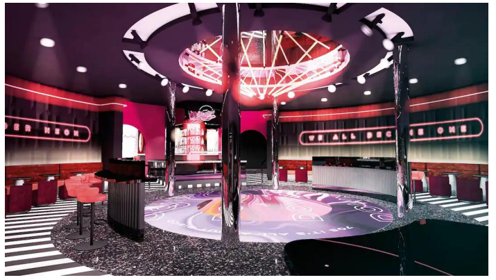
Marella Voyager Electric Rooms bar ja lounge