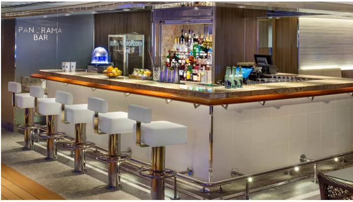
Rotterdam Panorama Bar