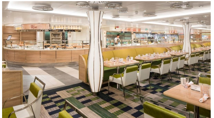
Rotterdam Lido Market