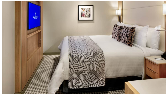
Rotterdam parvekehytti