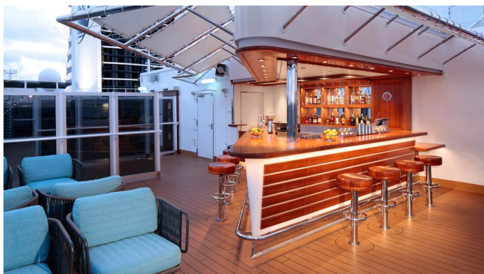
Rotterdam Tamarind terassi