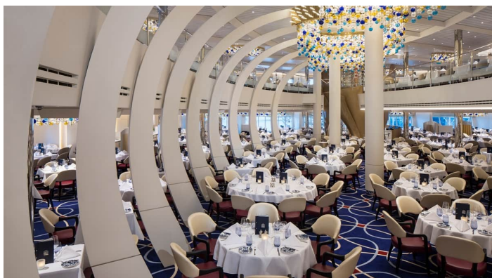
Rotterdam RollingStone