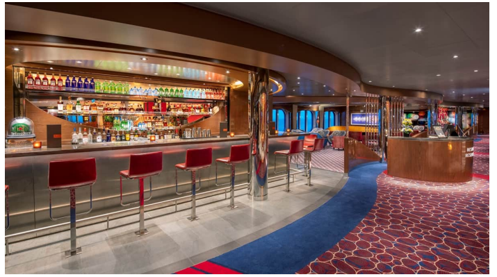
Rotterdam Ocean Bar