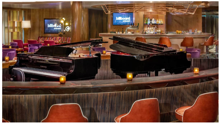
Rotterdam Billboard