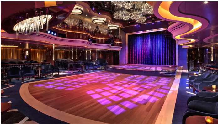
Rotterdam BB Kings