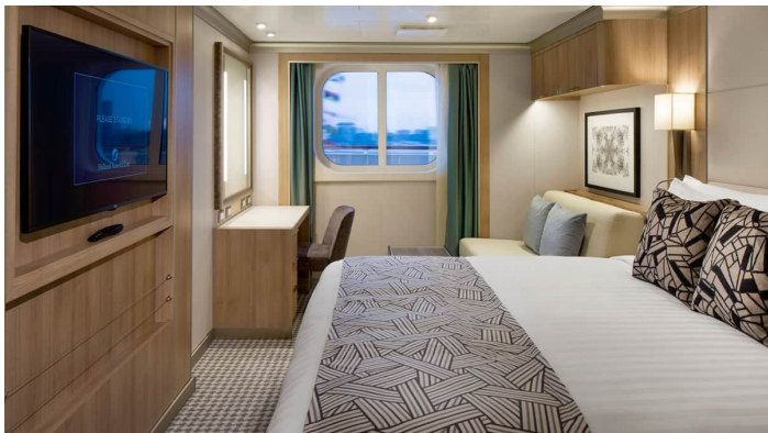
Rotterdam Vista Suite