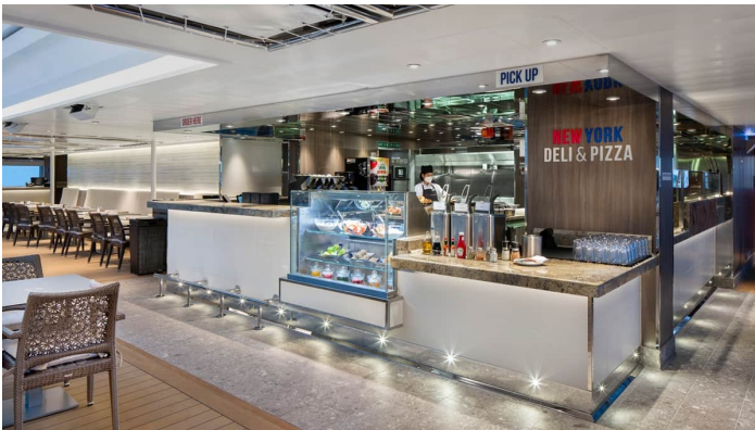
Rotterdam New York Pizza