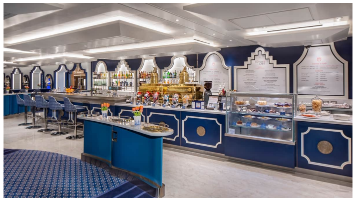
Rotterdam Grand Dutch Cafe