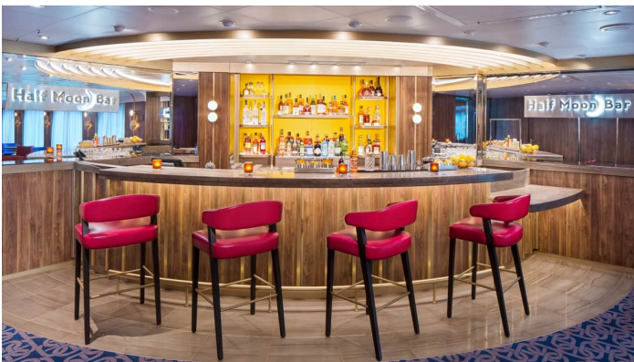
Rotterdam Half Moon Bar