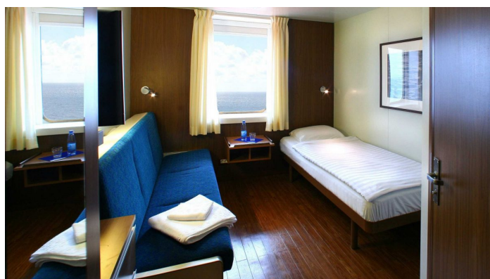
Ikkunallinen A-luokan hytti