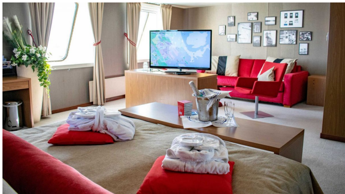
Ikkunallinen Owner's Suite