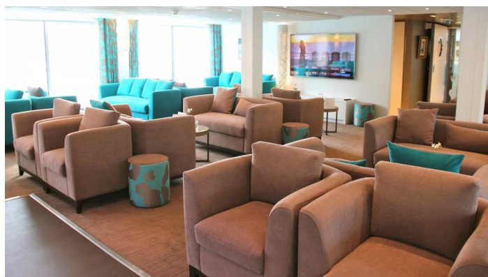
Gil Eanes Lounge Bar 3 CroisiEurope©Giorgetti