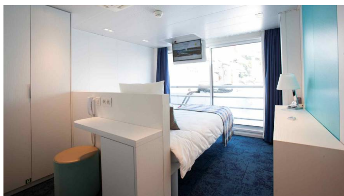
Sviitti keskimäinen kansi MS Gil Eanes