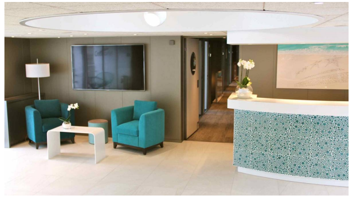
Gil Eanes Lounge Bar 2 CroisiEurope©Giorgetti