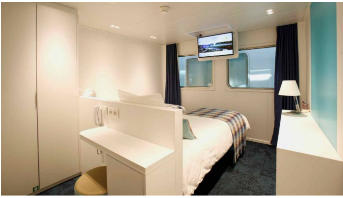
Kahden hengen hytti alin kansi CroisiEurope©Bruno Ribeiro