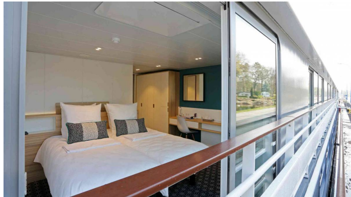
Elbe Princesse ikkunallinen hytti2 ylempi kansi CroisiEurope©O