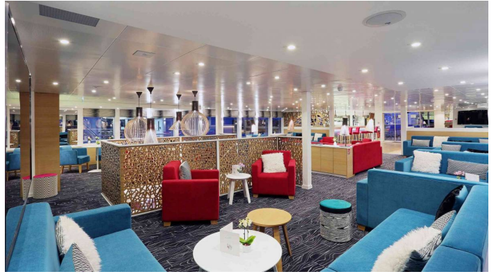
Elbe Princesse ravintola