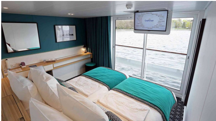
Elbe Princesse ikkunallinen hytti ylempi kansi

Kaikkien hyttien varustukseen kuuluvat TV, puhelin (sisäpuhelut), kylpyhuone (suihku ja WC), pyyhkeet, tallelokero, säädettävä ilmastointi ja hiustenkuivain. Alemman kannen hyteissä on iso panoraamaikkuna. Ylemmän kannen hyteissä on avattava lasiovi ranskalaisella parvekkeella.