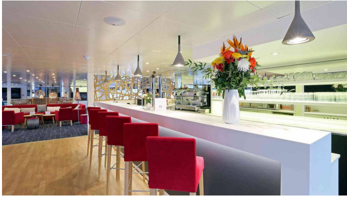
Elbe Princesse ravintola