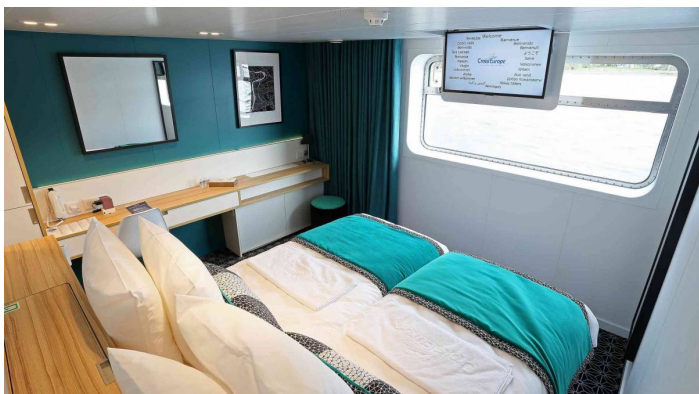
Elbe Princesse ikkunallinen hytti pääkansi CroisiEurope©O