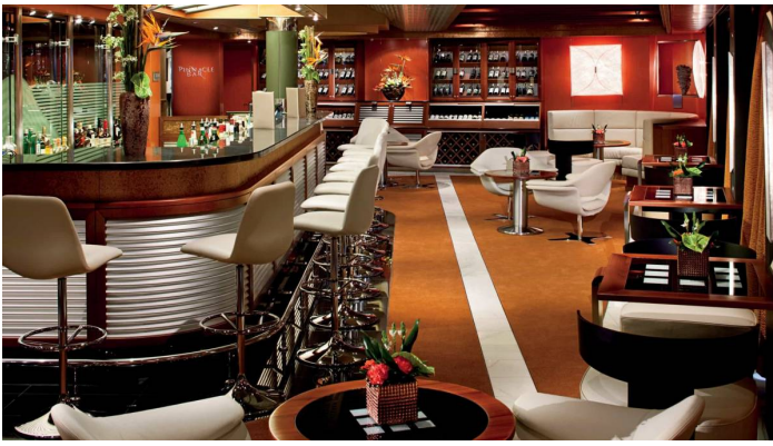
Pinacle Bar Nieuw Amsterdam