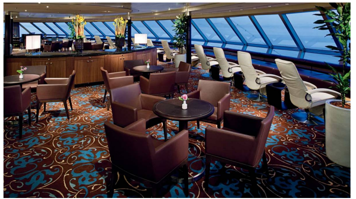
Explorations Cafe Nieuw Amsterdam