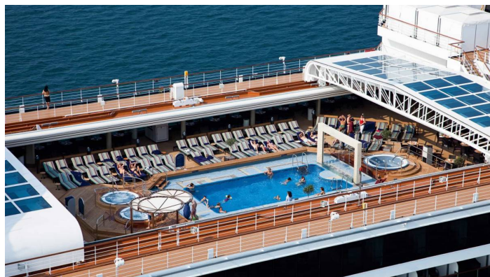
Canaletto ravintola Nieuw Amsterdam ©HollandAmericaLine Allaskansi Nieuw Amsterdam ©HollandAmericaLine