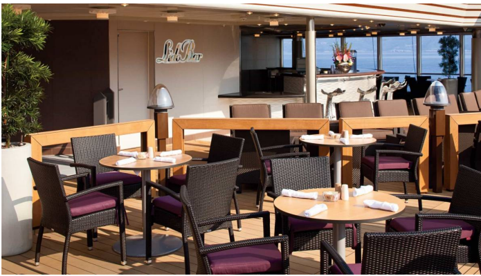
Lido Bar Nieuw Amsterdam