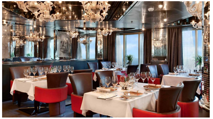
Nieuw Amsterdam Master Chef room