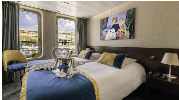
Ikkunallinen hytti ylempi kansi CroisiEurope©Muamer Mujevic