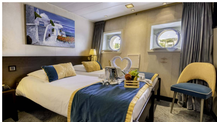
Ikkunallinen hytti alin kansi CroisiEurope©Muamer Mujevic