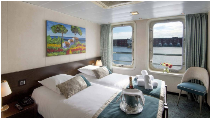
Ikkunallinen hytti ylempi kansi

Kaikissa hyteissä on TV, sisäpuhelin, kylpyhuone (suihku ja wc), pyyhkeet, tallelokero, ilmastointi, sähkö 220 V ja Wi-Fi. Ylemmän- ja laivaannousukannen hyteissä on isommat ikkunat, pää- ja alimman kannen hyteissä on pyöreät venttiili-ikkunat.